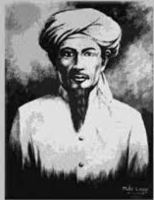
SYEKH YUSUF TAJUL KHALWATI